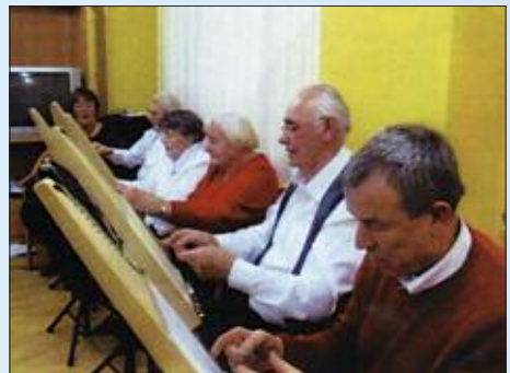
■ Der ehemaligen Konsum-Managerin gelang es, ein Veeh-Harfen-Ensemble zusammenzustellen, dessen ältestes Mitglied fast 100 Jahre alt ist.