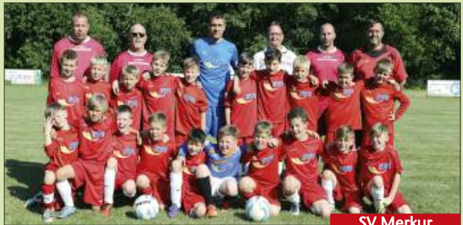
SV Merkur Kablow-Ziegelei

■ Neben Fußball spielen bei „Askania Kablow“ Tanzen und andere Sportarten eine große Rolle.