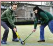
50 Jahre Hockey-Metropole S. 16-18

Hinweise zur Broschüre: Tel. 030/692021 05