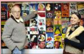
Mit Lenin-Stipendium in die Kunst-Welt S. 24-26