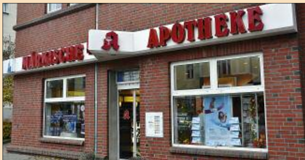
■ Die Märkische Apotheke liegt mitten im Zentrum der Stadt und ist gut erreichbar.

Die frühere Adler-Apotheke gibt es seit 1840. Sie wechselte mehrfach ihren Standort