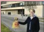
Beamte auf der Schulbank S. 20-21