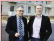
Kurze Wege in einer wachsenden Stadt S. 6-8