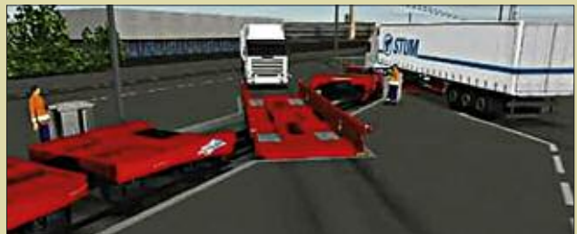
Die Sattelaufleger können dann schräg auf drehbare Waggonladeflächen auffahren.

Lager, Umschlag und Transport Mittelbrandenburgische Hafengesellschaft mbH Hafenstraße 18 15711 Königs Wusterhausen Tel. 033 75/67 10 Fax 033 75/67 11 25 www.hafenkw.de