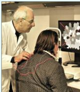
■ Die Elektrophysiologische Untersuchung der Netzhaut sorgt für gutes Sehen.