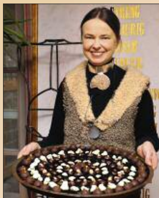
■ Süße Formen können auf unter- schiedliche Art zusammenkommen!