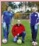
Runde Erfolge S. 10-12