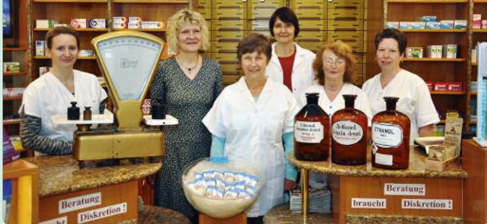
■ Für das Team hat die sichere Arzneimittelversorgung obersten Rang.