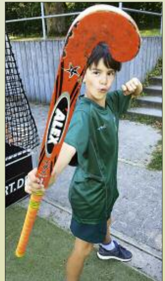
■ Jugendliche spielen im Verein eine große Rolle. Bereits mit vier Jahren kann man Hockey spielen.