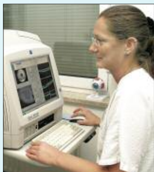
■ Mit dem OCT-Verfahren können frühzeitig Erkrankungen am Auge erkannt werden.

Im OP-Saal steht das derzeit weltweit modernste Operationsmikroskop zur Verfügung, mit dem der Chirurg jedes Detail der Netzhaut erkennt. Mit der optischen Kohärenztomographie, kurz OCT, wird weit über 1000 Mal im Jahr die Netzhaut ohne Berührung des Auges untersucht.