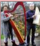
Märchen und Töne S. 42-44